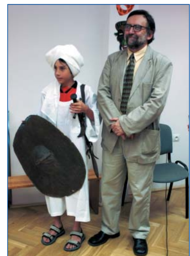
BIBLIOTEKA PUBLICZNA DZIELNICY WOLA