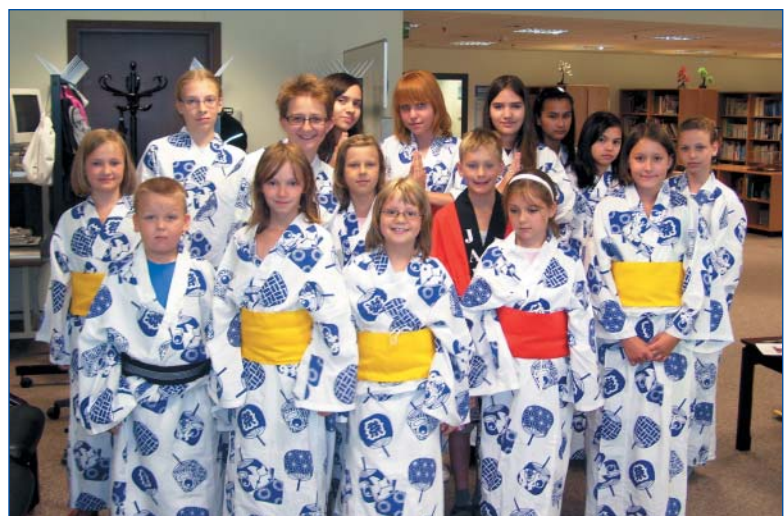
BIBLIOTEKA PUBLICZNA DZIELNICY WOLA

cztery spotkania. Udało się przybliżyć uroki kraju kwitnącej wiśni. Poprzez zabawę dzieci zaznały się z inną obyczajowością. Zobaczyły wnętrza japońskiego domu, dowiedziały się jak prawidłowo jeść pałeczkami, jak za ich pomocą częstować gości cukierkiem. Poznały rodzaje kimon, nauczyły się nakładać poszczególne warstwy ubioru i odpowiednio je zawiązać,