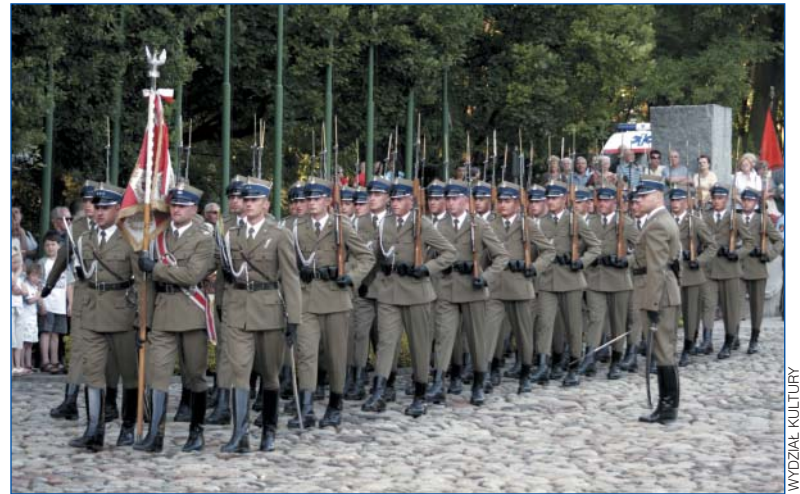
Przedstawiciele środowisk kombatanckich podczas uroczystości przy Pomniku „Polegli Niepokonani”