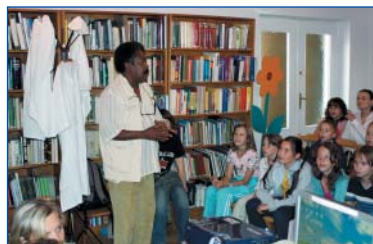
BIBLIOTEKA PUBLICZNA DZIELNICY WOLA

Ciekawi świata młodzi ludzie mogli poznać w lipcu nie tylko kulturę afrykańską, ale również japońską, dzięki attache kulturalnemu ambasady, który zaprosił nas na